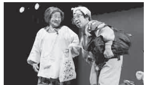
↑今年も爆笑を誘った、妙見ものずき劇団

「第5回歳末助け合いチャリティーショー」が12月5日、竹田市文化会館で開かれました。