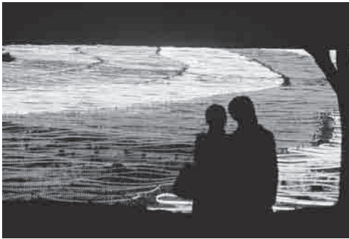
↑光ファンタジアを見物する恋人たち

色鮮やかな光の花畑 久住高原くじゅう花公園で11月28日から12月27日まで「光のファンタジア」が行われました。シーズンオフの約4000平方メートルの敷地に、幻想的な音楽に合わせて約40万個のLEDが光り輝きます。 11月25日の点灯式にも多くの見物客が訪れ、ロマンチックな彩りの花畑を楽しんでいました。