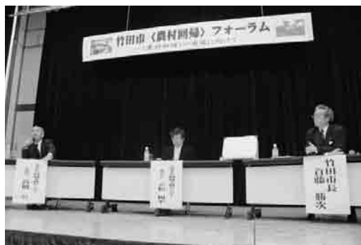
↑トークセッション(竹田市総合社会福祉センター)

今こそ、長い歴史と文化に培われた個性にさらに磨きをかけ地域に元気を取り戻すとともに外に向かって竹田の情報を発信し、団塊の世代や田舎暮らしを夢見る人を受け入れる環境整備と条件整備を行う。