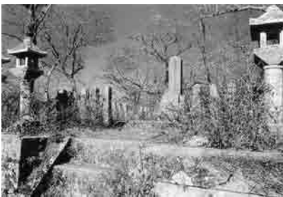
↑国指定史跡入山公廟

中川清秀より5代、岡藩主秀成（1594年入城）より3代目の城主久清（隠居後入山と号す 1615（1681）は、徳川光圀ほか天下7賢将の1人に数えられたほどの名将で、熊沢蕃山を呼んで治山（三宅山の植林など）治水（城原井路や緒方井路など）を行