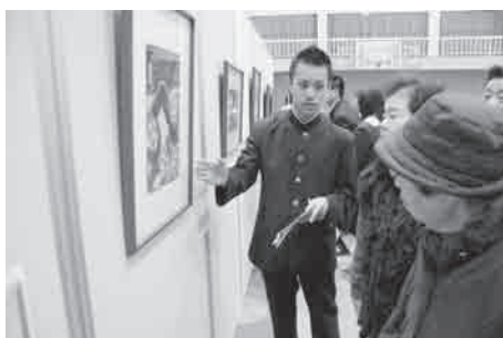
↑生徒は1日学芸員を体験