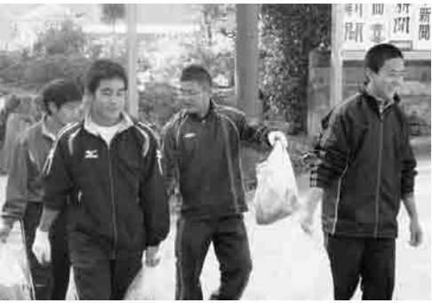
↑空き缶などを拾いながらのボランティア遠足