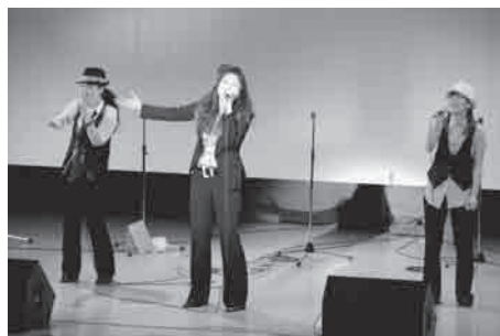
↑民謡「久住高原の唄」アカペラver.には大きな拍手! アカペラでメリークリスマス!

アカペラコンサート「ダイナマイトしゃかりきサカス」が12月9日、くじゅうサンホールで開かれました。 アカペラによるクリスマスソングからポップスが次々と披露され、会場はひと足早いクリスマス気分を満喫していました。