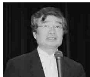
↑「和をもって貴しとなす」の精神で受け入れましょう。」(ふるさと回帰支援センター理事長 立松和平さん)