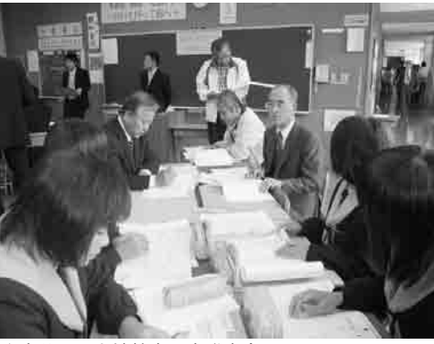
↑大分県へき地教育研究発表会