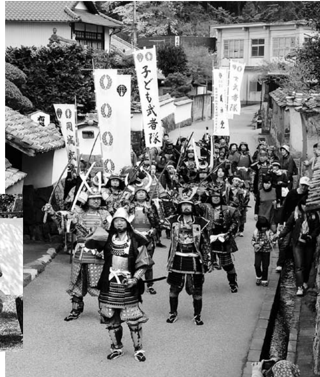
↑ 勝ち鬨を上げる市長演じる総大将（甲冑武者行列）