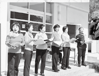
←美声で花を添えた コールマミーなおいりのみなさん