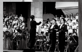
↑文部科学省「特色ある大学教育支援プログラム」採択記念特別地域演奏会（2005年）