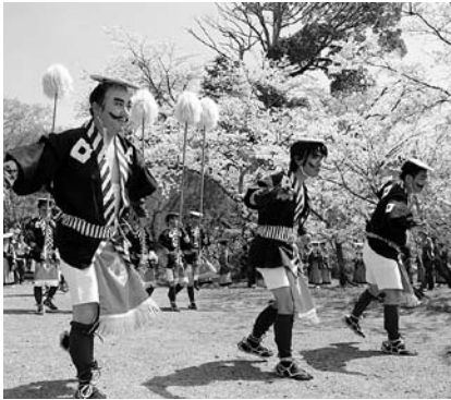
↑ 岡城内を練り歩く大名行列