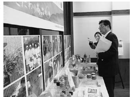
こだわりの新商品展示コーナー （竹田温泉花水月1階）

なお、「エリアラボ竹田」でも従来通り、事業の紹介や商品の展示の他に、事業の相談窓口として休まず営業していますので、お気軽にお立ち寄り下さい。地域雇用創造「実現事業」の内容を紹介します。