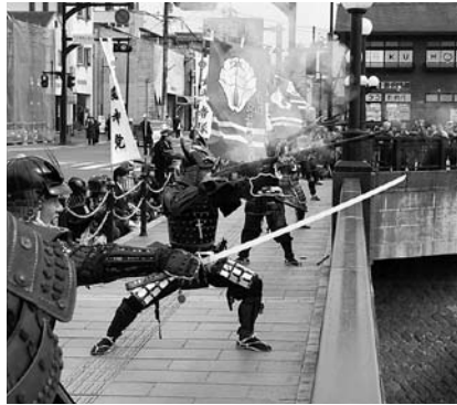
↑ 鳴り響く火縄銃の発砲