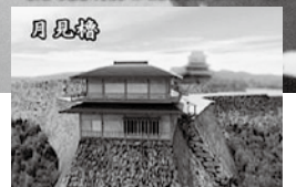
↑岡城跡の3次元CGによる復元（2007年）