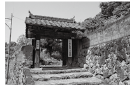
↑佐藤武郎美術館（2008年）