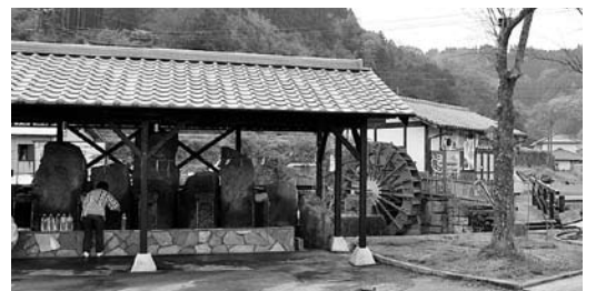
↑ 新しい水汲み場が完成（河宇田湧水）

平日でも市内外から多くの湧水ファンが訪れる「河宇田湧水」に屋根付きの水汲み場が完成し、4月19日竣工式が行われました。