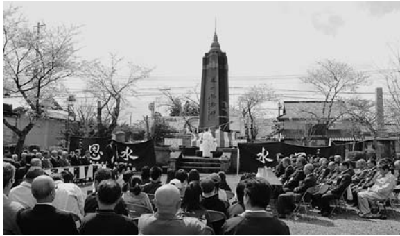
↑荻柏原土地改良区の「第87回水恩祭」