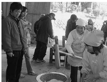
↑117名参加したもちつき大会

交流会「白水そうめん流し」、3月に神原地区のみなさんに招待された「緒環ひいな祭り」。地域の人やお年寄りとの交流を通して、子どもたちは、お年寄りとの会話の楽しさや、昔ながらの遊びの楽しさ、自然のものを楽しむ知恵やそれを利用する技のすばらしさに気づくことができました。