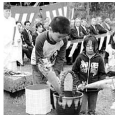
↑社会勉強で参加した荻小学校の5年生による献花

通水を記念して市内各地で「水恩祭」が開催される中で、4月10日、荻柏原土地改良区の「第87回水恩祭」が改良区通水記念碑前(荻町馬場)で行われました。 先人の熱い思いに対して、今を生きる私たちが未来に何を残すべきか、大きな決意をもって望まなければなりません。 これからも市内の全ての土地改良区の皆さんと連携し、農村のあるべき姿を追求するなかで、市と致しましても不断の努力を続ける覚悟を新たにしました。