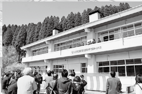
↑多くの地域住民が足を運んだ開所式