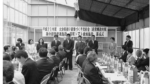
↑ 荻町トマト栽培施設を増設（エコファーム21）

平成21年度大分県強い農業づくり交付金（経営構造対策事業）による「複合経営促進施設 荻町トマト栽培施設」落成式が4月12日、エコファーム21（荻町恵良原）で行われました。ハウス面積8千850平方メートル。今後ますますの農業の活性化が期待されます。