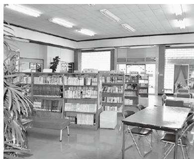
土日祝を除き、午前10時から午後6時まで開館している図書室