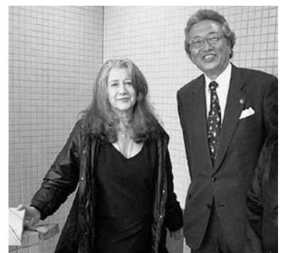
↑緊張と感動の初対面を果たしました