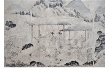
↑「木浦鋳山錫製錬図(部分) 佐伯市歴史資料館蔵」

料 一般500円 65歳以上250円 小中学生300円 未就学児無料 各種障害者手帳提示者とその介護者1名は無料