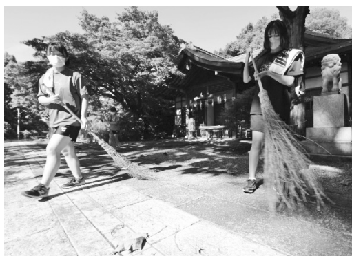
↑ 部活で利用する廣瀬神社で落ち葉集め

7月28日、大分県立竹田高校の生徒による地域奉仕活動が行われました。この活動は日ごろお世話になっている通学路や部活等で利用している場所に感謝を込めて年に2、3回行われており、1年生から3年生の有志およそ160人が城下町周辺や廣瀬神社を歩きながら