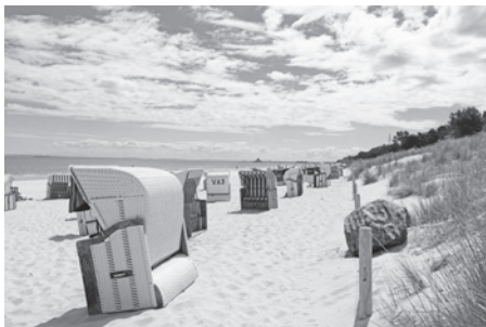
↑北ドイツ・バルト海のビーチ

皆さん、もしも1週間の休暇があったら何をしますか?1週間さまざまな観光地を回りたいですか?それとも数日間は旅行に行って、残りの時間は家でゆっくりしたいですか?きっといろいろな理想的な旅行を思いつくでしょう。 「休暇」はドイツ語で「Urlaub」(ウアラウプ)といいます。ドイツ人がウアラウプについて話すときに決まってイメージするのは「夏」「太陽」「ビーチ」「海」(Sommer, Sonne, Strand und Meer)です。寒い時期が長いドイツを離れて暖かい国の浜辺やプールで泳いだり、太陽を浴びたり、たまに近くの町へ散歩やショッピングに行くことを想像します。 具体的には、北ドイツのバルト海や南ドイツのアルプスなどの国内旅行や、スペインやイタリア、北欧諸国など、少し離れたヨーロッパの国への旅行が人気です。また、