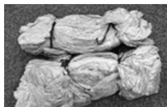
農業用廃ビニール

※農ビニールと農ポリに分類して持ち込んでください。分類や梱包の方法など詳細は市公式ホームページをご覧ください。