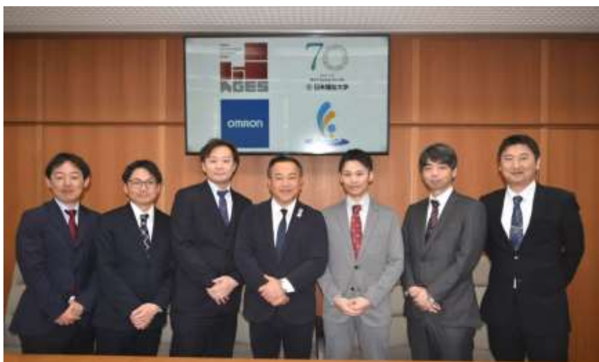
竹田市での成果報告会実施時の関係者による記念撮影

なお、本検証結果はオムロン株式会社から日本福祉大学、日本老年学的評価研究機構が受託した研究の一部です。