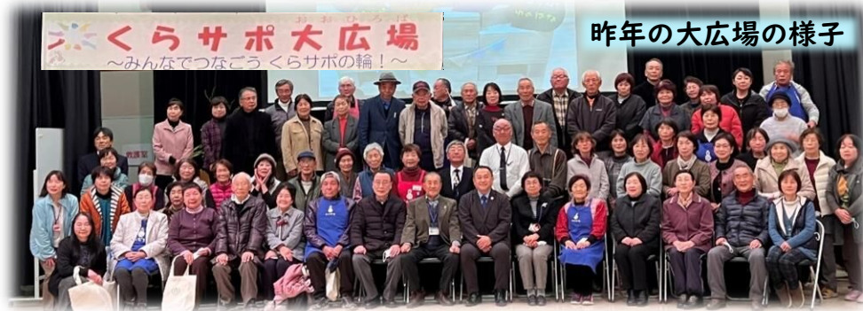
昨年の大広場の様子