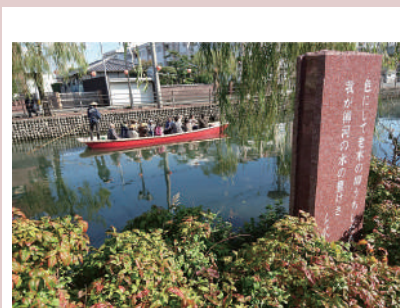
白秋歌碑とどんこ舟