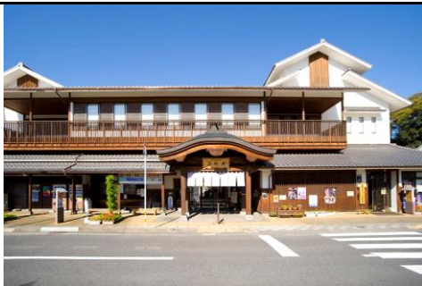
竹田温泉花水月外観①