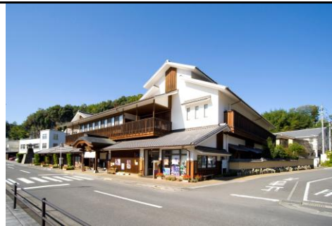
竹田温泉花水月外観②