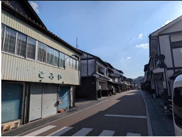
空き店舗が目立つ通り①