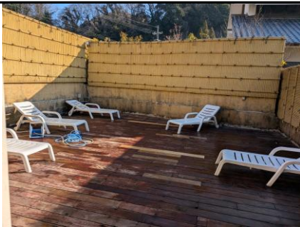
有効活用されていない外浴スペース