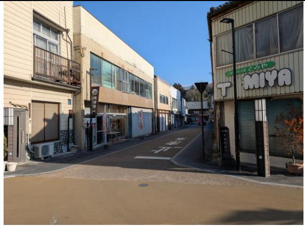
空き店舗が目立つ通り②