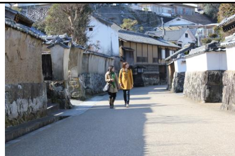
城下町の面影を残す通り④