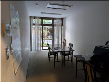
活用されていない会議スペース