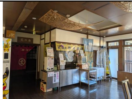
撤退予定の食事コーナー