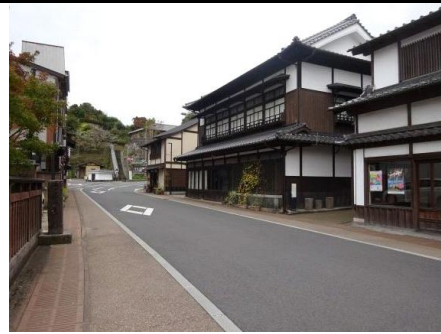
空き店舗が目立つ通り④