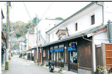
城下町の面影を残す通り③