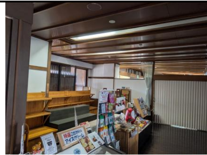
有効活用されていない売店スペース②