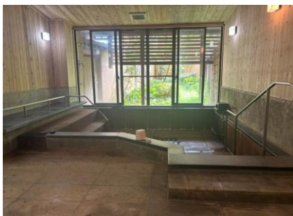
オーバーサイズの家族風呂