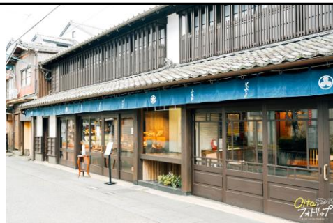
城下町の面影を残す通り②