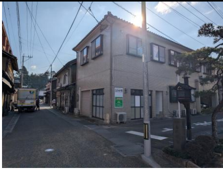
空き店舗が目立つ通り③