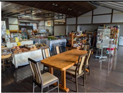
有効活用されていない売店スペース①