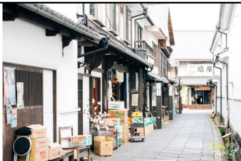
城下町の面影を残す通り①