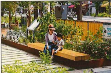
ベンチやデッキで休憩したり、談笑したりできる