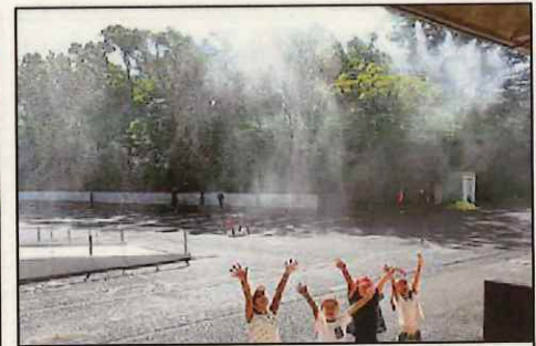
霧の中で涼を感じながら、夏を快適に過ごせる