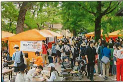
マルシェやフリマで特産品や雑貨などの買物が楽しめる