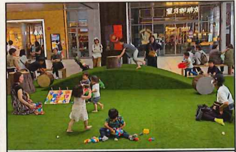
人工芝の上で子どもが自由に遊ぶことができる