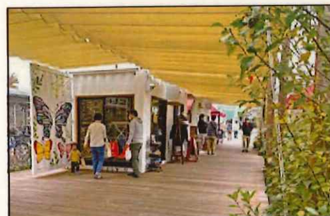
地元の人が新しいお店を試することができる