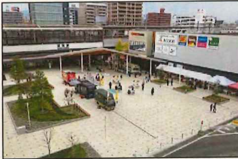
広々とした空間にテーブルやイスなどを自由に配置できる