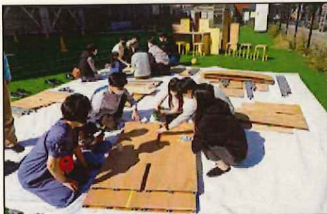
屋外ワークショップで学びや体験ができる