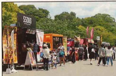
キッチンカーが出店し、手軽に飲食できる