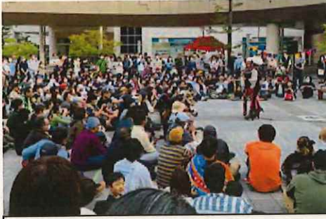
生のダンスや音楽などを観て、盛り上げられる