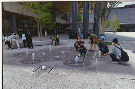
竹田らしい水を感じながら遊べる