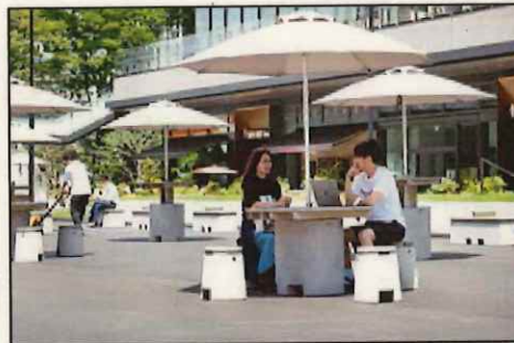
雨や日差しをよけて、快適にくつろげる