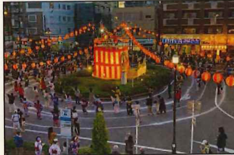
夏祭りやイルミネーションなどのイベントが楽しめる