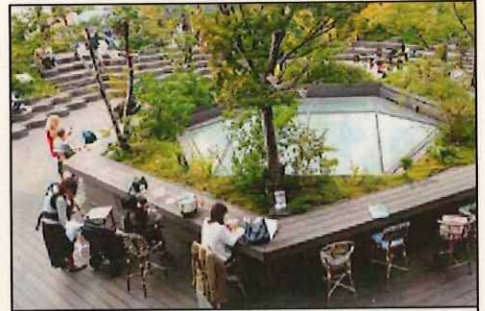
常設のテーブルで飲食や作業などができる