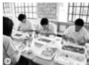
↑①・②市内の児童生徒と交流を深めた「竹田子ども交流集会」 ③吹きガラス工房「マグマ グラス スタジオ」ではモザイクガラス体験