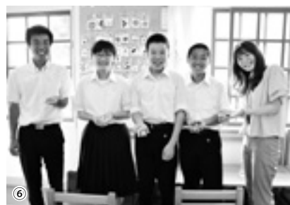
↑⑥3日間を通して竹田の歴史文化を学んだ3人は、同校で開かれる文化祭でその体験を発表する予定です

◆ ◆ ◆ 児童生徒と交流を深め、竹田の歴史文化や産業について学んだ3人の中学生。3日間の体験を記事にまとめ、9月に開かれる文化祭「稲穂祭」で発表する予定とのこと。