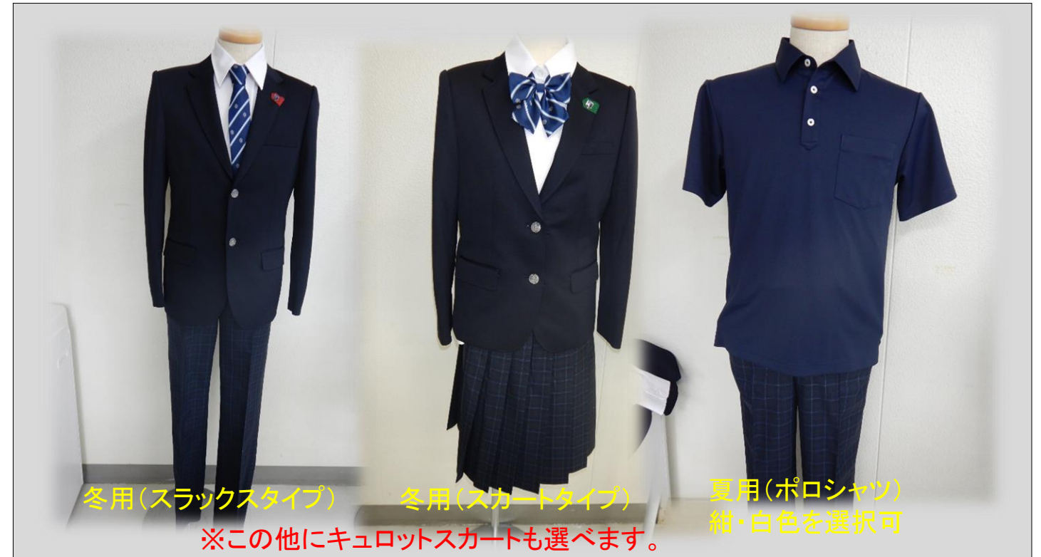
冬用(スラックスタイプ)

児童・生徒と保護者へのデザイン投票を参考に検討委員会で協議した結果、以下のデザイン(投票番号:No.D)に決定しました。決定したデザインは、児童・生徒と保護者へのデザイン投票で一番人気のデザインでした。スカートやスラックス、キュロット等が自由に選べる制服を導入します。