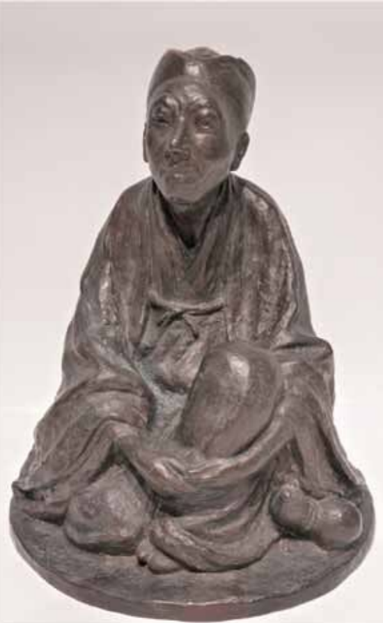
渡邊長男 「田能村竹田座像」1943年 竹田市歴史文化館蔵