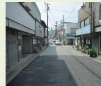
空き家・空き店舗状況

空き家や空き店舗の有効活用をとおり、城下町を形成する建造物を再生し、地域の活性化及び良好な景観形成の促進を図ることを目的に、再生に必要な改修等に対し補助金を交付します。