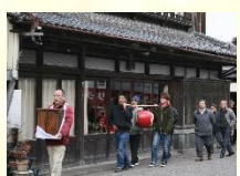
恵比寿講での町廻りの様子

早春に行われる恵比寿講は、歴史的建造物が数多く残される城下町で行われます。華やかさはないが昔ながらの町家と溶け込んだ城下町住民の繁栄を支えてきた町家の人々の住民活動の礎となる行事です。