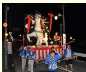
久住夏越祭の曳山車行事

8月に久住神社とその周辺地域で行われる久住夏越祭では、神輿の神幸や曳山車の「ヤマヤレ、元気出せ」の掛け声と山車囃子の音色が、高原の町久住に夏の訪れをつける風物詩となっています。