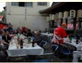
神明社の大祭の様子

5月に行われる古町地区の神明社の大祭は、神事や神楽の奉納が行われます。参拝者に寿司が振舞われることから「すし祭」とも呼ばれ、城下町の入り口として繁栄してきた古町地区の固有の歴史的風致を見ることができます。