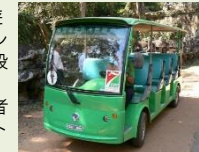
周遊バスのイメージ

城下町や岡城跡を回遊する周遊自動車等やレンタル自転車等の交通手段を構築することにより、高齢者や身障者の来訪者に対し優しい回遊ルート構築します。