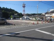
城下町回遊館建設予定地

城下町の中心部に位置した場所に、城下町を訪れる来訪者の為の案内施設及び地域住民の文化拠点施設とし、誰もが気軽に訪れ交流を深めることができ、中心市街地の賑わいを創出できるような施設整備を行います。