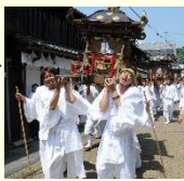
夏越祭の御神幸の様子

城原八幡社の神輿が城下町へ御神幸し城下町の3社を廻る夏越祭は、氏子である城下町の町家の人々により、江戸時代から継承されていきます。城下町と農村部の人々の繋がりが感じられる竹田の夏の情景です。