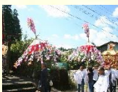
神保会行事の神幸行列

10月に宮処野神社とその周辺地域で開催される宮処野神社神保会行事では、獅子舞や白熊が先導する華やかな御神幸行列が整然とした姿で田園風景が広がる郊野地区を進んで行きます。