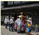
八朔祭の御神幸の様子

西宮神社の鎮座する本町地区の氏子により行われる八朔祭は、塩屋土蔵や旧竹屋書店などの歴史的建造物が残される通りの店先に日用品で造られた見立て細工が飾られる、城下町の風物詩となっています。