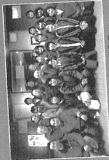
道の駅きよかお夢市場のスタッフ