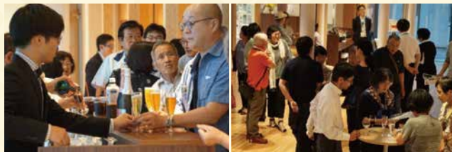
2019年6月に開催されたレクチャーコンサートの様子。休憩時間中ロビーにて、海外さながらにシャンパングラスを手に楽しむ竹田市民。(廉太郎ホール/竹田市)