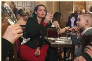
休憩時間のカフェオベラでワインを楽しむ来場者。(ラトヴィア国立歌劇場/リガ)

海外の劇場では、大人も子どももおしゃれを楽しんでいます。休憩中には飲み物と一緒にちょっとした食べ物を味わいながら、みんなと談笑をして、優雅な時間を過ごしています。