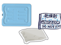
湿布薬、保冷剤、使い捨てカイロ、ペットのトイレ砂等