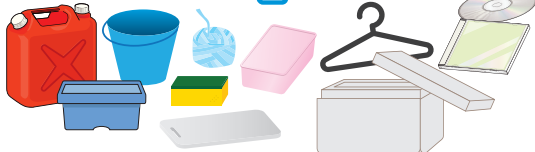
タッパー、ポリバケツ、衣装ケース、プランター、おもちゃ、CD・DVD、カセットテープ、ケース類、発泡スチロール容器