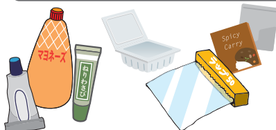
汚れの落ちにくいものや洗にくいもの チューブ類、カレー等レトルト容器、ラップ類