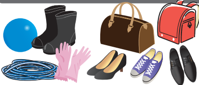
長靴、ボール、ゴム手袋、ホース(紐で縛って)、靴・かばん類、ベルト、ランドセル等