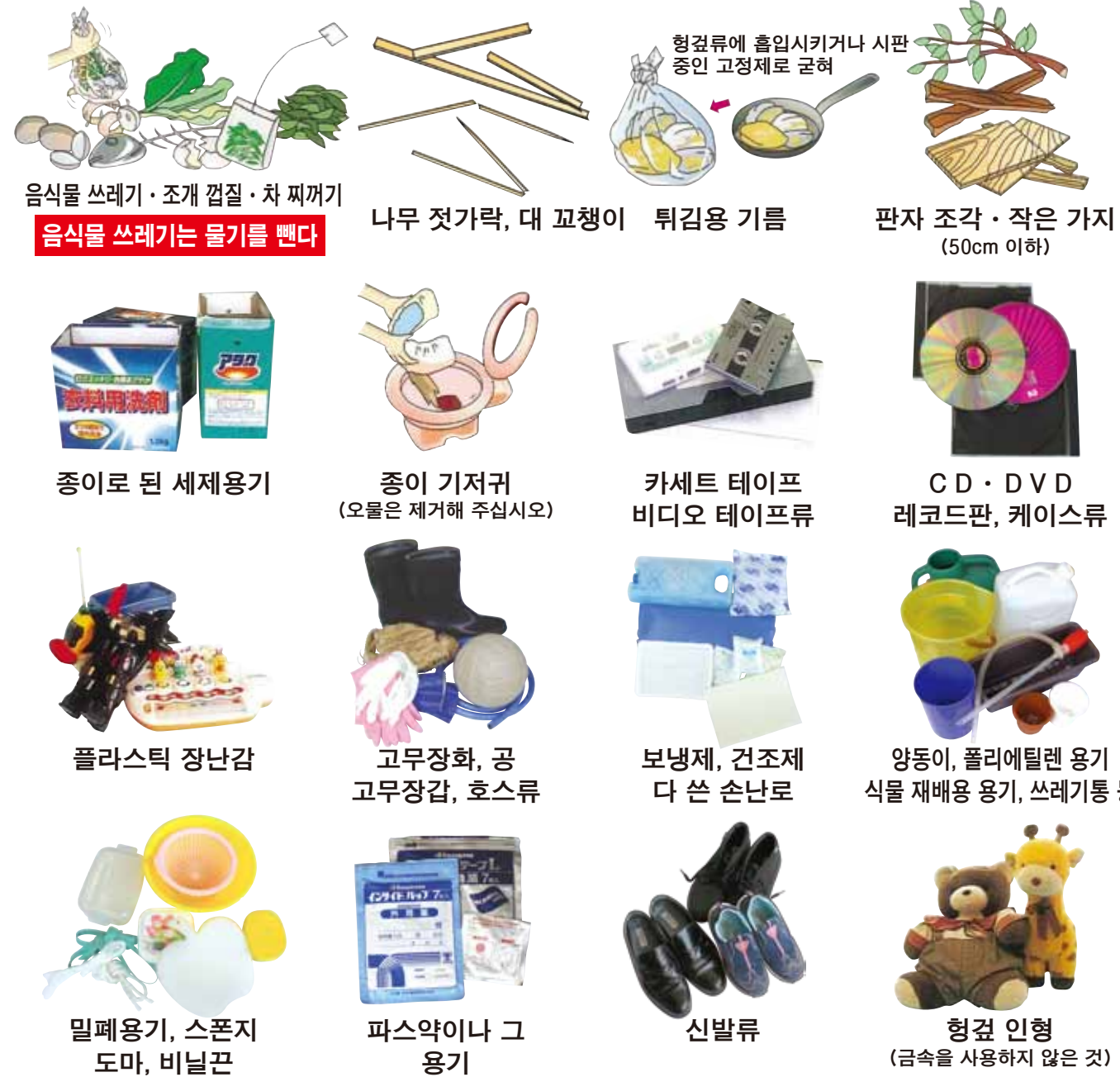
음식물 쓰레기 · 조개 껍질 · 차 찌꺼기 음식물 쓰레기는 물기를 뺀다 나무 젓가락, 대 꼬챙이 튀김용 기름 판자 조각 · 작은 가지 (50cm 이하) 종이로 된 세제용기 종이 기저귀 (오물은 제거해 주십시오) 카세트 테이프 비디오 테이프류 CD · DVD 레코드판, 케이스류 플라스틱 장난감 고무장화, 공 고무장갑, 호스류 보냉제, 건조제 다 쓴 손난로 양동이, 폴리에틸렌 용기 식물 재배용 용기, 쓰레기통 등 밀폐용기, 스폰지 도마, 비닐 끈 파스약이나 그 용기 신발류 형견 인형 (금속을 사용하지 않은 것)

가정용 음식물 쓰레기 처리기의 보조제도가 있습니다.문의 환경위생과 TEL 63-4821