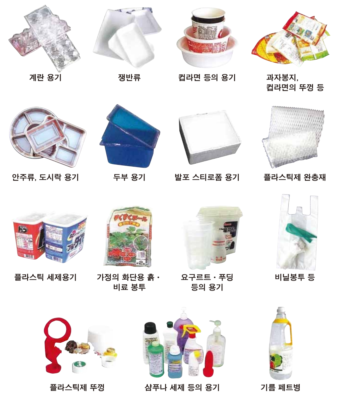
계란 용기 쟁반류 컵라면 등의 용기 과자봉지, 컵라면의 뚜껑 등 안주류, 도시락 용기 두부 용기 발포 스티로폼 용기 플라스틱제 완충재 플라스틱 세제용기 가정의 화단용 흙 · 비료 봉투 요구르트 · 푸딩 등의 용기 비닐봉투 등 플라스틱제 뚜껑 샴푸나 세제 등의 용기 기름 페트병

♻️ 마크가 붙은 용기 포장품만 넣어 주십시오. ※ 용기는 반드시 물에 가볍게 헹궈 주십시오. プラマーク