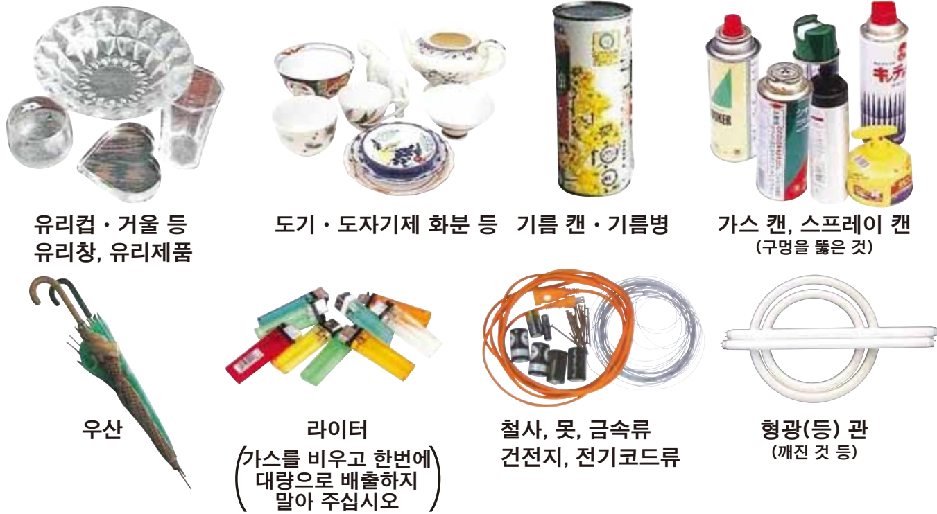
유리컵 · 거울 등 유리창, 유리제품 도기 · 도자기제 화분 등 기름 캔 · 기름병 가스 캔, 스프레이 캔 (구멍을 뚫은 것) 우산 라이터 (가스를 비우고 한번에 대량으로 배출하지 말아 주십시오) 철사, 못, 금속류 건전지, 전기코드류 형광(등) 관 (깨진 것 등)

가스봄베, 스프레이 캔은 반드시 구멍을 뚫어 내부의 가스를 비운 뒤 배출해 주십시오.