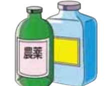
도료, 시너, 페유, 농약, 극약 등